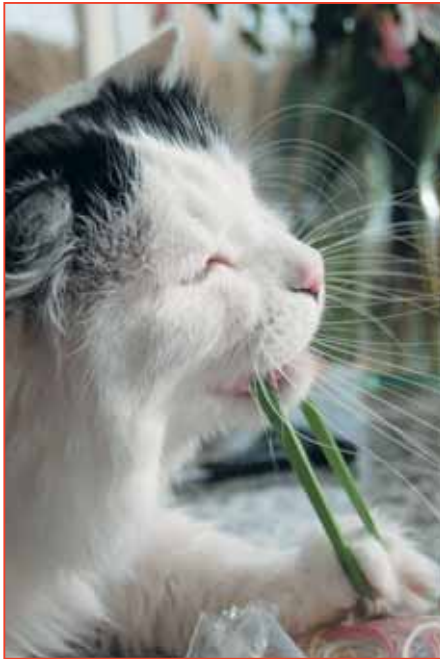
Solche und ähnliche extrem gefährliche Gegenstände gehören immer unter absolut sicheren Verschluss.