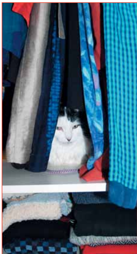
Tabuzone Kleiderschränke – die Gefahr, dass die Katze unbemerkt hineinspringt und versehentlich eingeschlossen wird, ist sehr gross.