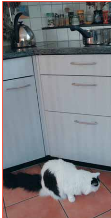
Niemals sollte der Stiel einer Pfanne auf dem Herd nach aussen gerichtet sein.

Der Fall liegt einige Jahre zurück: Ein junger Mann, durch einen Verkehrsunfall an den Rollstuhl gefesselt, hatte aus meiner Zucht drei Katzen. Die Tiere waren sein Ein-