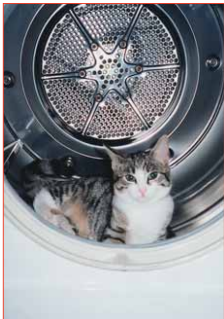
Manche Katze hatte einen qualvollen Tod, weil sie in einem unbewachten Moment in die bereits eingefüllte Waschmaschine sprang.