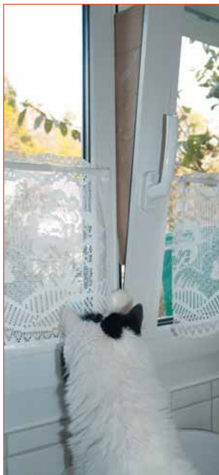
Auch mit einfachen Mitteln können Kippfenster geschützt werden: Einfach einen Karton in Keilform zuschneiden und in den Spalt schieben (und am besten: Fenster schon gar nicht kippen).

Ich sass an einem Freitagabend im Oktober in einer Sitzung, als meine Sitzungskollegin ein Telefon erhielt, man sehe da etwas in ihrem Badezimmerfenster hängen, das sich hin und her winde. Ob das wohl ihre Katze sein könne? Man sehe es aus der Entfernung in der Dämmerung nicht so genau. Einen Schlüssel habe man ja nicht, und in den