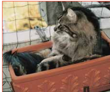
Für kleine Kätzchen kann ein normal grosses Schutznetz zur tödlichen Falle werden – es gibt kleinmaschigere für sie!

Meine Katzen haben einen grossen, eingezäunten Terrassenauslauf, Tag und Nacht. Das zwei Meter hohe Schutznetz ist