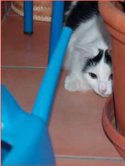
Nicht nur wegen Düngemittel im Wasser können Giesskannen Katzen gefährlich werden.